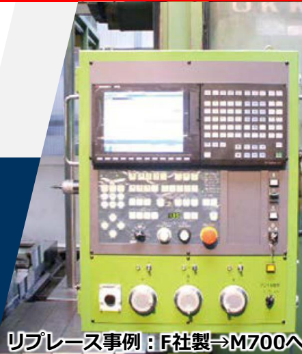
リプレース事例：F社製⇒M700へ