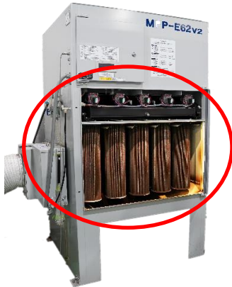
上記機種はMFP-E62v2です。機種により形状は異なります。