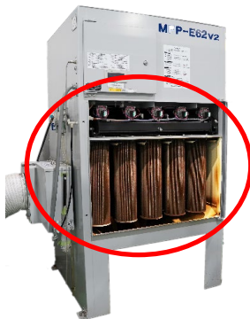
上記機種はMFP-E62v2です。機種により形状は異なります。

◆交換周期は1年または運転3000Hrとなります。目詰まりしていないか一度ご確認ください。