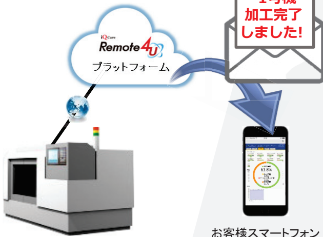
お客様スマートフォン

今日は大事なお客様の納品がある。 機械から加工完了のメールが来た。 これは便利だ！