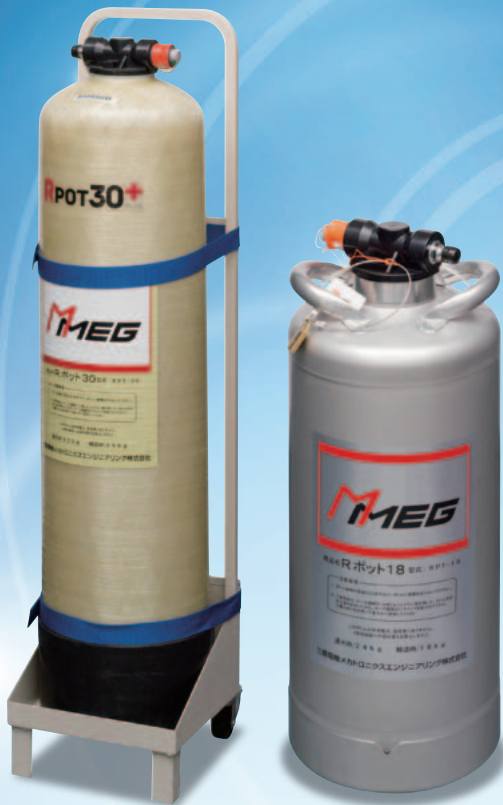
製品名:Rポット30プラス(RPT-30P)、Rポット18(RPT-18)