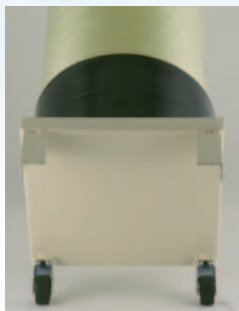
キャスター付台座標準装備 Rポット30プラス

※1: 当社従来比約30%向上(Rポット30)。 加工内容により、寿命時間は異なります。 ※2: タンク上への取付けは、最寄のコールセンターへご相談下さい。